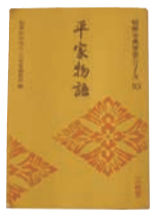
↑ 今、持ち歩いている本「平家物語」歴史が好きです。