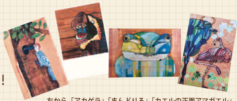
左から「アカゲラ」「まんどりる」「カエルの正面アマガエル」 「黒牛とフラミンゴと 四葉のクローバー」 阿山隆之 ポストカード 各150円 [木馬工房]