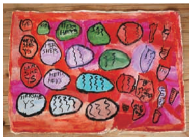
↑ イラストを描いているのは「結の会」で作った和紙です。絵の具を塗り、乾いては色を塗ることを繰り返します。

毎年5月と10月に「八王子古本まつり」というおまつりを行っています。古書の販売、地元団体や地元企業の展示即売などです。古本まつりは今回で第10回を迎えますが、この中の「ゆるゆるテント(福祉団体による手づくり品)」「はちたま探検(八王子・多摩に関する書籍)」は他の古本市にはない目玉企画として好評を得ています。物を売るだけではなくふだんは立ち止まることのないユーロードで、「ゆっくり腰を落ち着けてみたらどんな感じか」を多くの方に体験していただきたいと思い始めました。ユーロードなどの商店街はお客としていくことはあっても、そこでお店(小さなブースでも)を開くことはなかなか難しいです。でも、ここで座っているとちょっとおもしろいのです。「視点の変化」とでもいいますが、いつもの見慣れた街の風景が違ったものに見えるのです。