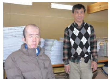
← 仕事仲間とハチリ

真面目で一生懸命な戸苺さん。時々、木曜日の納品に同行して帰りに生協の自動販売機でほうじ茶を買って飲むことも楽しみなんだそうです。