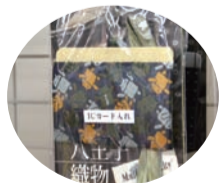
八王子織物の製品。カードケースや風呂敷、ネクタイなどがあります