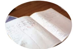
↑ 戸苺さんの仕事のノート。きっちりと管理しています。

率良く仕事を進められるかということも熱心に考えています。戸苺さんは、家ではお父さんとふたり暮らし。いつもヘルパーさんが家事を手伝いに来てくださるそうです。毎日、新聞に目を通して、朝はラジオを聴き、テレビで国会中継を見ることがあります。今、関心があるのは「TPP」問題です。